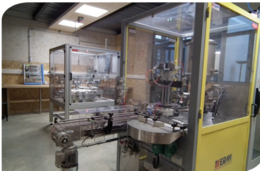
Ligne de conditionnement didactique