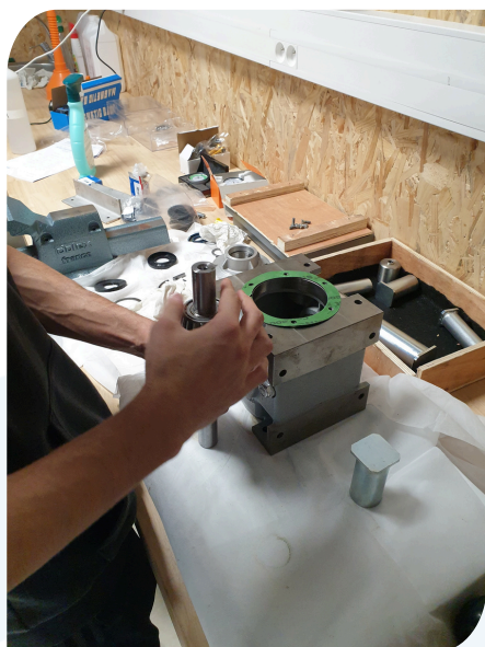
Kit pédagogique mécanique industrielle