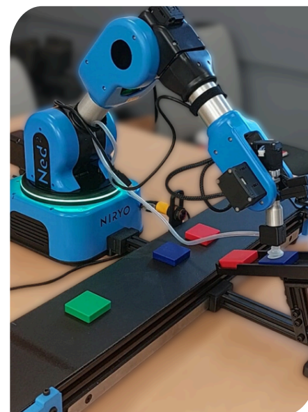
Kit pédagogique cobotique

Notre formation intègre une part de Formation Ouverte et à Distance (FOAD) qui s'appuiera sur une plateforme d'apprentissage en ligne accessible à tout moment (360 learning), proposant des modules interactifs, des ressources téléchargeables et des activités d'auto-évaluation. Un tutorat à distance sera assuré par nos formateurs pour accompagner votre progression et répondre à vos questions via des forums dédiés et/ou des sessions de visioconférence ponctuelles.