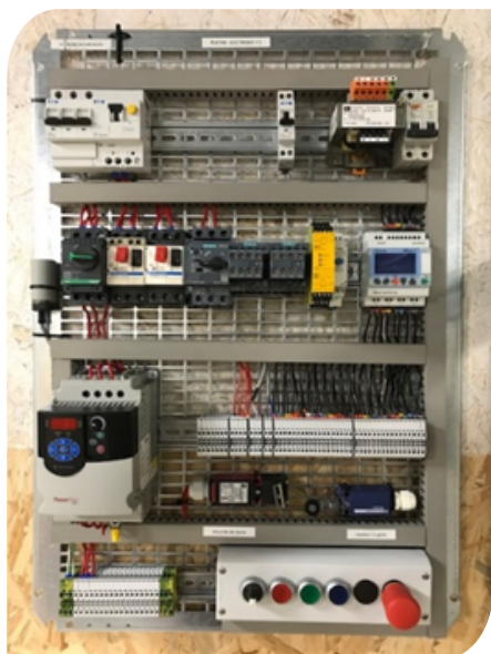
Exemple platine électrique

Sur poste de travail : Machines, outils/installations et ressources de l'entreprise.